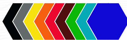
Kolory na zamówienie