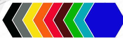
Kolory na zamówienie