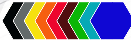
Kolory na zamówienie