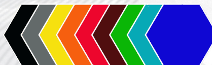
Kolory na zamówienie