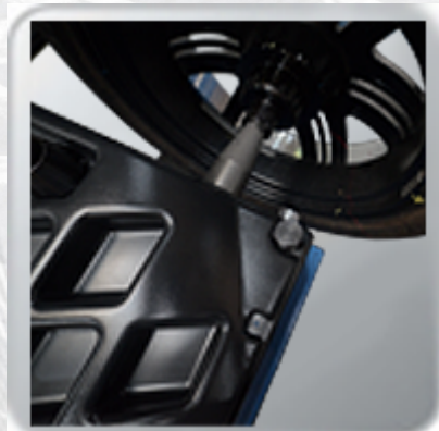
Ergonomic tool tray.