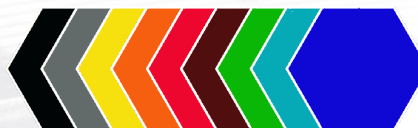
Kolory na zamówienie