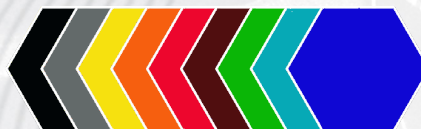
Цвета на заказ