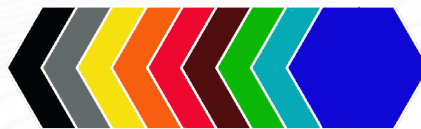
Kolory na zamówienie