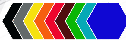
Kolory na zamówienie