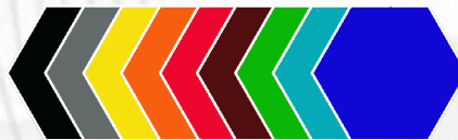
Kolory na zamówienie