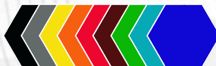
Kolory na zamówienie