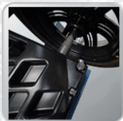
LED touch panel.