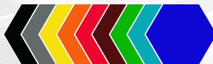
Kolory na zamówienie