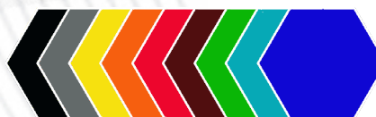
Kolory na zamówienie