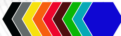
Kolory na zamówienie