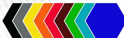
Kolory na zamówienie