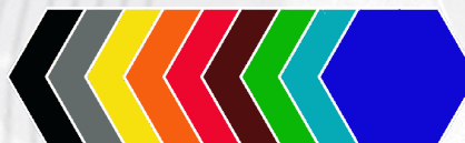
Kolory na zamówienie