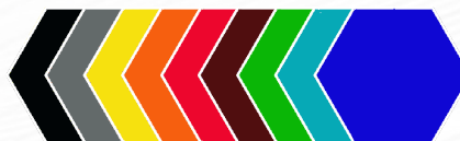
Kolory na zamówienie